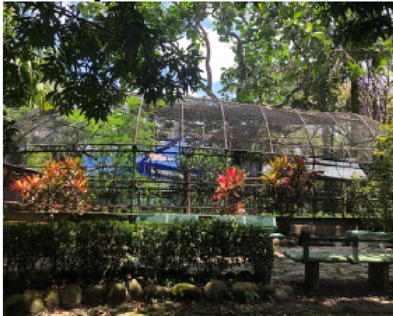
Fotografía No. 2. Área de exhibición A3.

El zoológico/acuario cuenta con una exhibición diseñada y habilitada a las necesidades físicas y biológicas de los especímenes que serán reubicados.