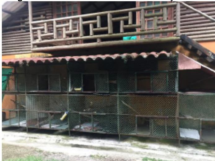
Fotografía No. 1. Jaulas de acercamiento y cuarentena

Como primera actividad en el momento de la recepción de un ejemplar al Bioparque Los Ocarros, la unidad de biología se encarga de ingresar al individuo a un área de cuarentena (Fotografía No. 1.), en el que inicia un proceso llamado acercamiento. Este consta de realizar acercamientos blandos con otros individuos de la misma especie, en el que puedan verse e interactuar, con el fin de obtener una inclusión efectiva y permanente. El tiempo estimado para esta actividad dependerá del concepto previo del Departamento de Salud y Bienestar Animal, la unidad de nutrición y preparación de alimentos, además del comportamiento de cada uno de los individuos.