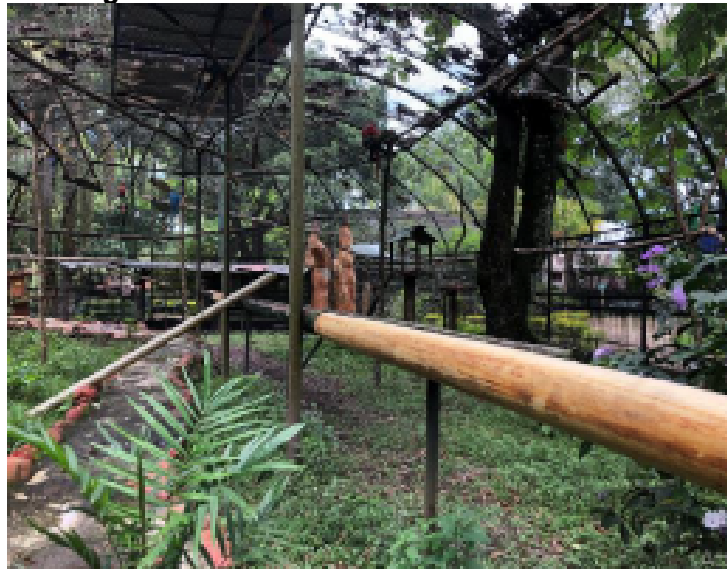
Fotografía No. 3. Interior del área de exhibición A3

Estos se ubican en varias zonas altas con mosquetones de seguridad, asegurando que las aves tomen su alimento con facilidad y no desciendan al suelo.